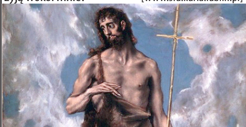
El Greco, „Święty Jan Chrzciciel”

W jaki sposób realizuję misję Jana Chrzciciela. Jak nawołuję moich bliźnich do nawrócenia? Jak pomagam innym przygotować się na spotkanie z Jezusem? (takie spotkanie to Eucharystia, słuchanie słowa Bożego, modlitwa, celebrowanie sakramentów, katecheza, nabożeństwa, choroba, śmierć...) Jak wskazuję przychodzącego Jezusa, tym, którzy żyją wokół mnie? [www.sfd.kuria.lublin.pl]