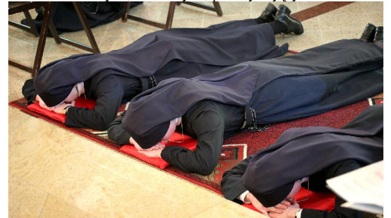
Siostry Szarytki podczas składania uroczystej profesji zakonnej.

Przez Cudowny Medalik Najświętsza Panna wciąż udziela łask zgodnie ze swoją zapowiedzią: „Wszyscy, którzy nosić go będą z ufnością, otrzymają wiele łask”. O łaski Maryja zaleciła prosić modlitwą wrytą na medaliku: „O Maryjo bez grzechu poczęta, módl się za nami, którzy się do Ciebie uciekamy”. Siostry Szarytki, odpowiadając na łaskę objawienia, prowadzą grupy Stowarzyszenia Dzieci i Młodzieży Maryjnej oraz rozpowszechniają Cudowny Medalik zwłaszcza wśród chorych, samotnych, przeżywających trudności.