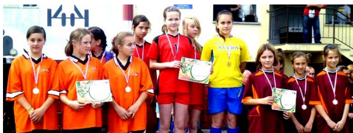
Dnia 11 maja 2013 r. w sobotę, w Łukowie odbędzie się IV Diecezjalna Parafiada Szkół Podstawowych Diecezji Siedleckiej (chłopców i dziewcząt).

Rywalizację obejmą dyscypliny: piłka nożna, piłka siatkowa, pływanie, tenis stołowy, warcaby, rzuty do kosza, biegi przełajowe, bieg na 60 m, skok w dal, przeciąganie liny. Przewidywane są puchary, dyplomy i medale dla zwycięzców, oraz pamiątki dla uczestników. W trakcie turnieju odbędą się pokazy zaproszonych gości. Parafiada rozpocznie się godz. 9.00 Eucharystią w Parafii pw. NMP Matki Kościoła w Łukowie. Formularz zgłoszeniowy znajduje się na stronie www.barkasiedlce.ugu.pl Zgłoszenie należy przesłać na e-maila: slawekbylina@vp.pl do czwartku 9 maja do godz. 17.00. Zapraszamy także kapłanów i opiekunów wraz z dziećmi.