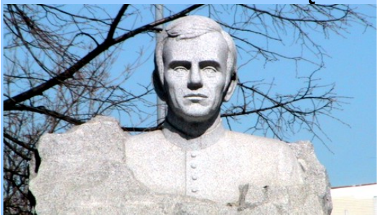
Kamienny pomnik ks. Jerzego Popiełuszki w Nowym Jorku na Greenpoint u zbiegu Nassau Ave i Bedford Ave w sąsiedztwie McCarren Park