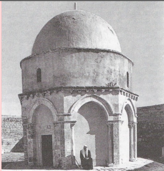
Jerozolima, Wczesnochrześcijański kościół upamiętniający miejsce Wniebowstąpienia Chrystusa (obecnie w rękach muzułmanów, którzy również uznają Chrystusa, jako Proroka i wierzą w Jego Wniebowstąpienie).