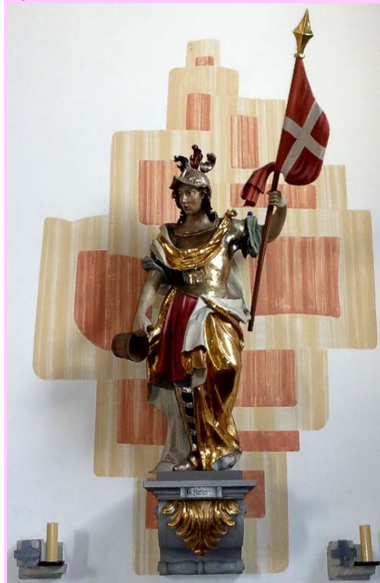
Rzeźba Św. Florianiana w kościele parafialnym w Markt am Inn, gdzie był ochrzczony Ojciec Św. Benedykt XVI.

Dziś Gośćmi naszej Parafii są Strażacy z Zawodowych i Ochotniczych Straży Pożarnych Powiatu Siedleckiego, którzy chcą tu oddać część swemu Patronowi Św. Florianowi oraz Patronowi „Prawdziwych Mężczyzn” Św. Józefowi. Witamy ich bardzo serdecznie.