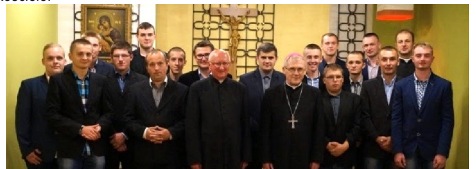
Klerycy z I-ego roku studiów Wyższego Seminarium Duchownego w Siedlcach