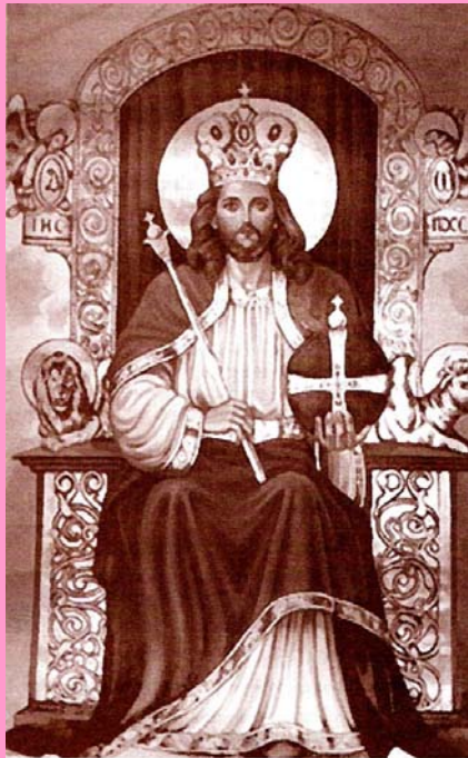
Staropolskie tłumaczenie hymnu z łaciny (XVIII wiek)

Narodów Królu świetlany, Wszech wieków Władco, o Chryste, Ty jeden dzierzysz bez zmiany Serc ludzkich berło wieczyste.