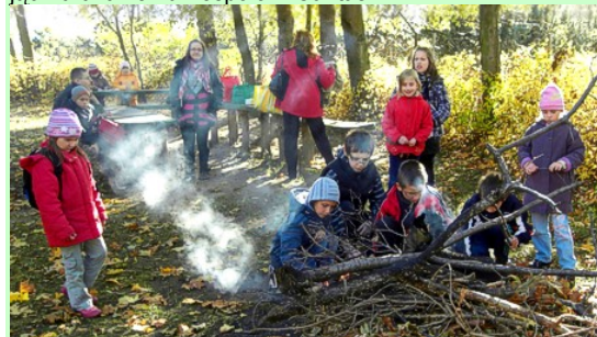
Dzieci i wychowawcy Świetlicy Przyparafialnej

Również dzięki pomocy Parafialnego Zespołu Caritas, który pokrył koszty przejazdu, zorganizowaliśmy wyjazdowe ognisko. Było ono na posesji Szkoły Podstawowej w Cisiu-Zagrudziu (gmina Kotuń), z którą współpracujemy. Na ognisku był także z nami Gość z USA. Bawiliśmy się wesoło, przełamując bariery językowe. Powyżej załączamy migawki z tej „imprezy” jeszcze raz gorąco dziękując Parafialnemu Zespołowi Caritas.