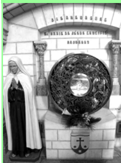
Karmeliński relikwiarz Bł. Siostry Marii