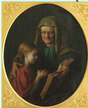
Muzeum Diecezjalne w Siedlcach, Św. Anna nauczająca, XIX w.

24 maja w święto NMP Matki Kościoła modlitwą różańcową Rozpoczyna Rodzice 32 Róży i będą modlić się otrzymaną tajemnicą do pierwszej soboty lipca, następnie przejdą do kolejnej. Odpowiedni moment wybrała św. Anna, wręczając w tym dniu swojej Córcie Maryni różę. Jest to także szczególne wyróżnienie dla Rodziców, których do Modlitwy za swoje dzieci zaprosiła Matka Królowej Różańca Świętego. Nie zachowały się żadne historyczne relacje o Jej życiu, wszystko co wiemy ma swe źródło wyłącznie w chrześcijańskiej tradycji. Rodzice Św. Anny byli potomkami królewskiego rodu Dawida. Nie posiadali ziemskich dóbr. Byli Troskliwi, sprawiedliwi i żyli w bojaźni Bożej,