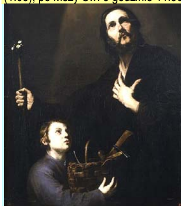
„Jezus podaje św. Józefowi kosz z narzędziami stolarskimi” - Jose de Ribera 1632, Muzeum Narodowe Prado w Madrycie

Po raz pierwszy w historii naszej Parafii Nabożeństwo to poprzedzi odpust ku czci Św. Józefa. Rozpocznie się w środę (28.04) Mszą Św. wieczorową, a zakończy procesją eucharystyczną w dniu odpustu (1.05), po Mszy Św. o godzinie 11.30.